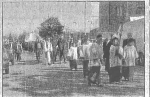
Signore per la sua morte e la sua risurrezione. In basso: la processione

"Un atto d'amore - ha aggiunto - che compiamo pregando il Signore per loro e la preghiera che facciamo, insieme, è la preghiera della santa messa, un inno di lode, un atto di profonda preghiera al Signore". Con la preghiera del giorno dedicato ai morti, ha poi proseguito, si entra nel mistero della morte e resurrezione di Gesù