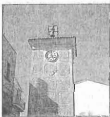
La torre dell'orologio

SAN MAURO FORTE - Oltre cento firme contro il lodo Alfano sono state raccolte dalla sezione di Sinistra Democratica di San Mauro Forte. La raccolta firme è a favore del referendum contro il cosiddetto lodo Alfano, la norma sull'immunità alle maggiori cariche dello Stato. La raccolta di oltre 100 firme in una sola giornata testimonia la sensibilità dimostrata dalla cittadinanza rispetto a questi temi. Continueranno anche nei prossimi mesi iniziative di sensibilizzazione come queste ed anche altre come quella programmata per la fine di novembre, con cui la locale sezione di Sd